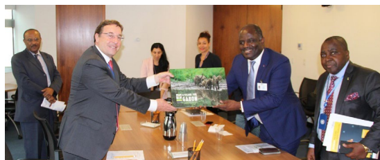
Le ministre Immongault Tatangani et M. Achim Steiner, Administrateur du PNUD (New York)

L'engagement et le leadership du Chef de l'Etat gabonais ont été salués par l'ensemble des participants qui ont exprimé leur volonté de faire de l'IAA un instrument pour la mise en œuvre de l'Accord de Paris sur le climat, en confirmant leur participation à la table ronde de haut niveau en septembre 2018, en marge de la 73 ème Assemblée générale des Nations Unies. L'objectif de la table ronde étant de mobiliser auprès des partenaires les 5 à 30 millions de dollars américains nécessaires au fonctionnement de l'IAA, et de lancer un rapport sur l'état de l'adaptation en Afrique.